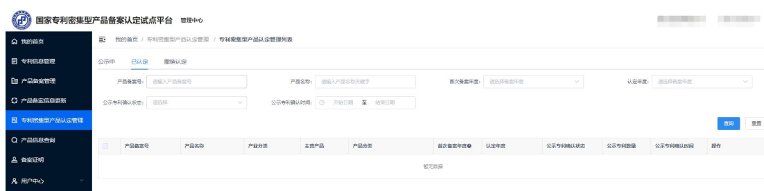
图 11 专利密集型产品认定管理列表页

在规定时间备案成功或完成信息更新的产品，可参与当年度专利密集型产品认定工作。符合认定条件的，获得专利密集型产品认定证书。