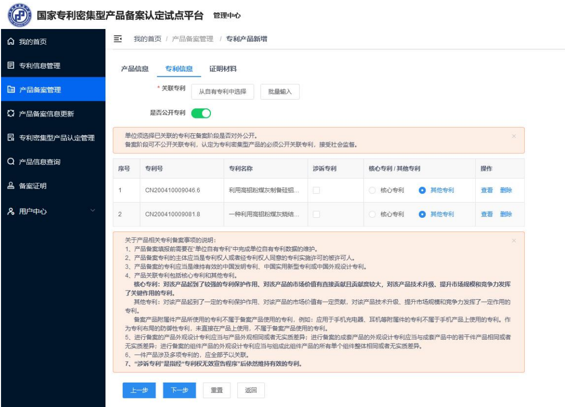
图 8 关联专利

⑦“涉诉专利”是指经“专利权无效宣告程序”后依然维持有效的专利，应注明案件编号。