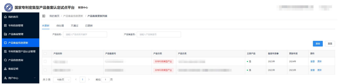
图 10 产品备案信息更新列表页

在“未更新”页面中，单位需更新新一年度的经营数据，并确认该产品信息和关联专利信息是否发生变化，根据实际情况对经济数据、关联专利等进行修改和更新。信息更新完成后提交。