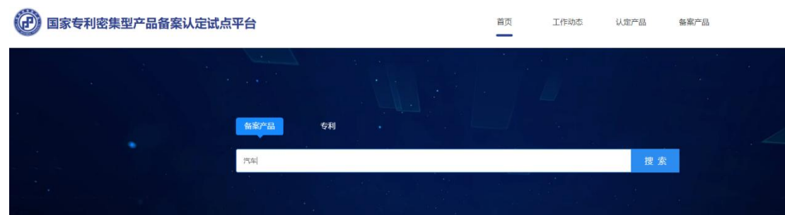
图 13 备案产品搜索

单位申报的产品通过备案后，社会公众可在首页搜索框，通过关键字查询相应的备案产品信息。