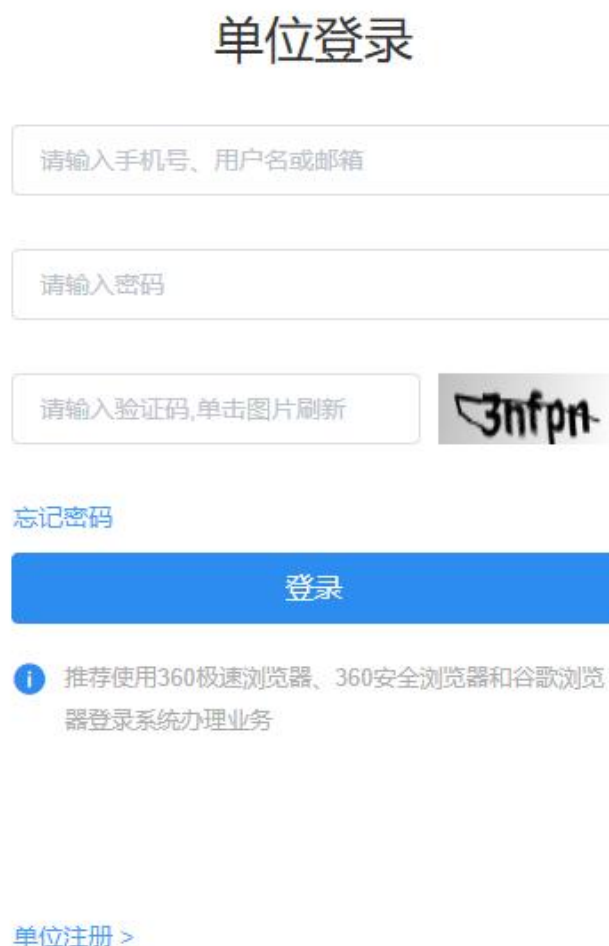
图 2 单位登录

注册成功后，用户输入已注册的手机号、用户名或邮箱（三种信息择一填入）、密码、验证码可直接登录系统。