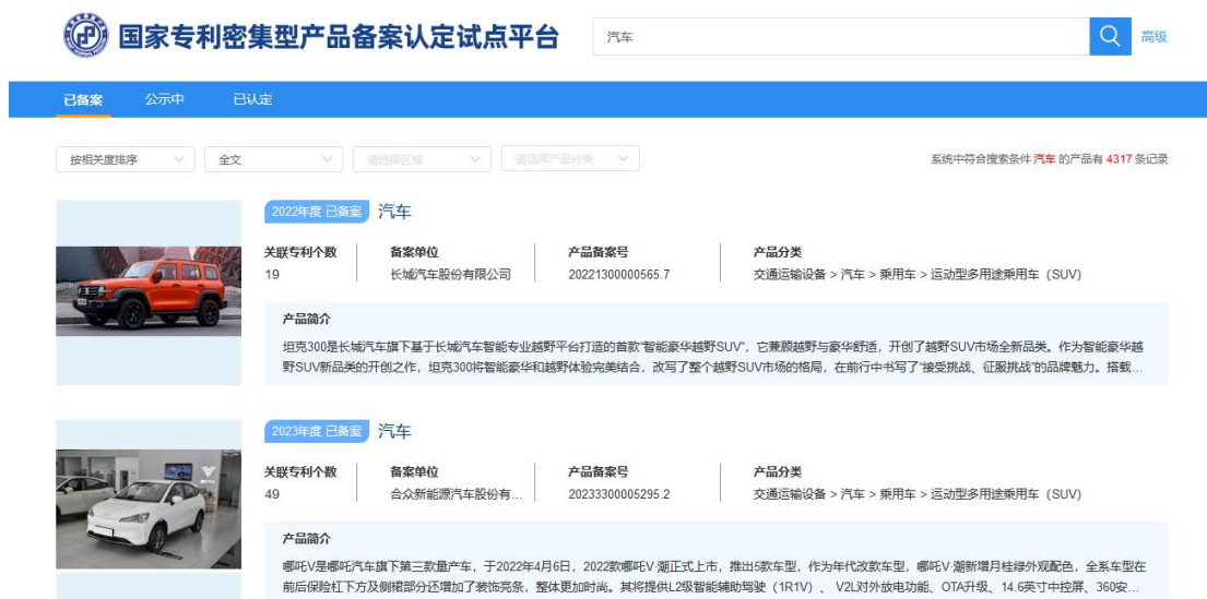
图 14 搜索结果列表页