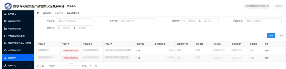
图 15 备案证明列表页

注意：备案证明具有时效性，仅用于证明下载备案证明时该产品已备案。若该产品由于复核不通过、公众异议、关联专利失效、备案单位主动撤回等情况导致备案状态发生变化，则备案证明将自动失去证明效力。该产品最终备案状态应以“国家专利密集型产品备案认定试点平台”查询结果为准。