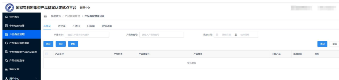
图 5 产品备案列表页